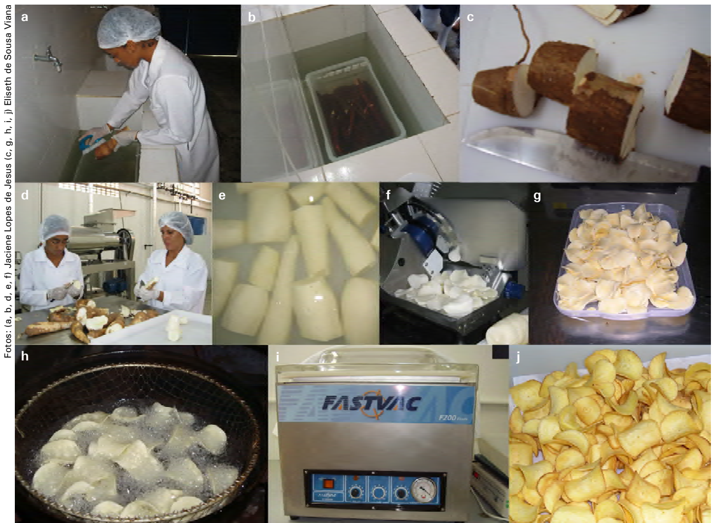
Figura 2. Etapas do processamento dos chips de mandioca: (a) lavagem, (b) sanitização (200 ppm de cloro ativo por 15 minutos), (c) corte em pedaços, (d) descascamento manual, (e) lavagem das raízes descascadas, (f) corte em fatias, (g) fatias, (h) fritura, (i) selagem e (j) chips de mandioca.

Nas variedades estudadas, esta tecnologia reduziu o teor de óleo entre 16 a 43% em relação ao processo que inclui a etapa de branqueamento anteriormente à fritura. Os chips elaborados pelo processo descrito foram analisados sensorialmente e tiveram boa aceitação pelos consumidores para todos os atributos avaliados. O rendimento do processo depende da matéria-prima utilizada com valores entre 15 a 35% do peso total das raízes.