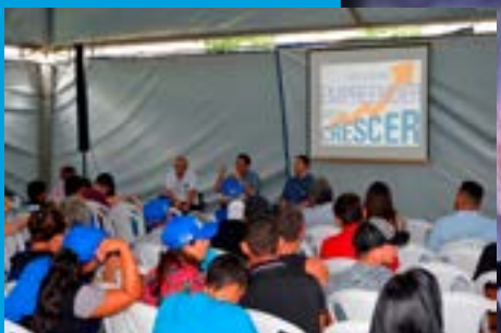
Participação de Rondônia em evento internacional supera expectativas

Porto Velho-RO, Abr. e Mai. de 2019, Edição N° 42