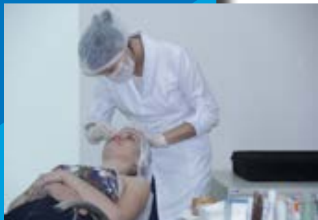
Semana do MEI em Cacoal com oficina na área da beleza