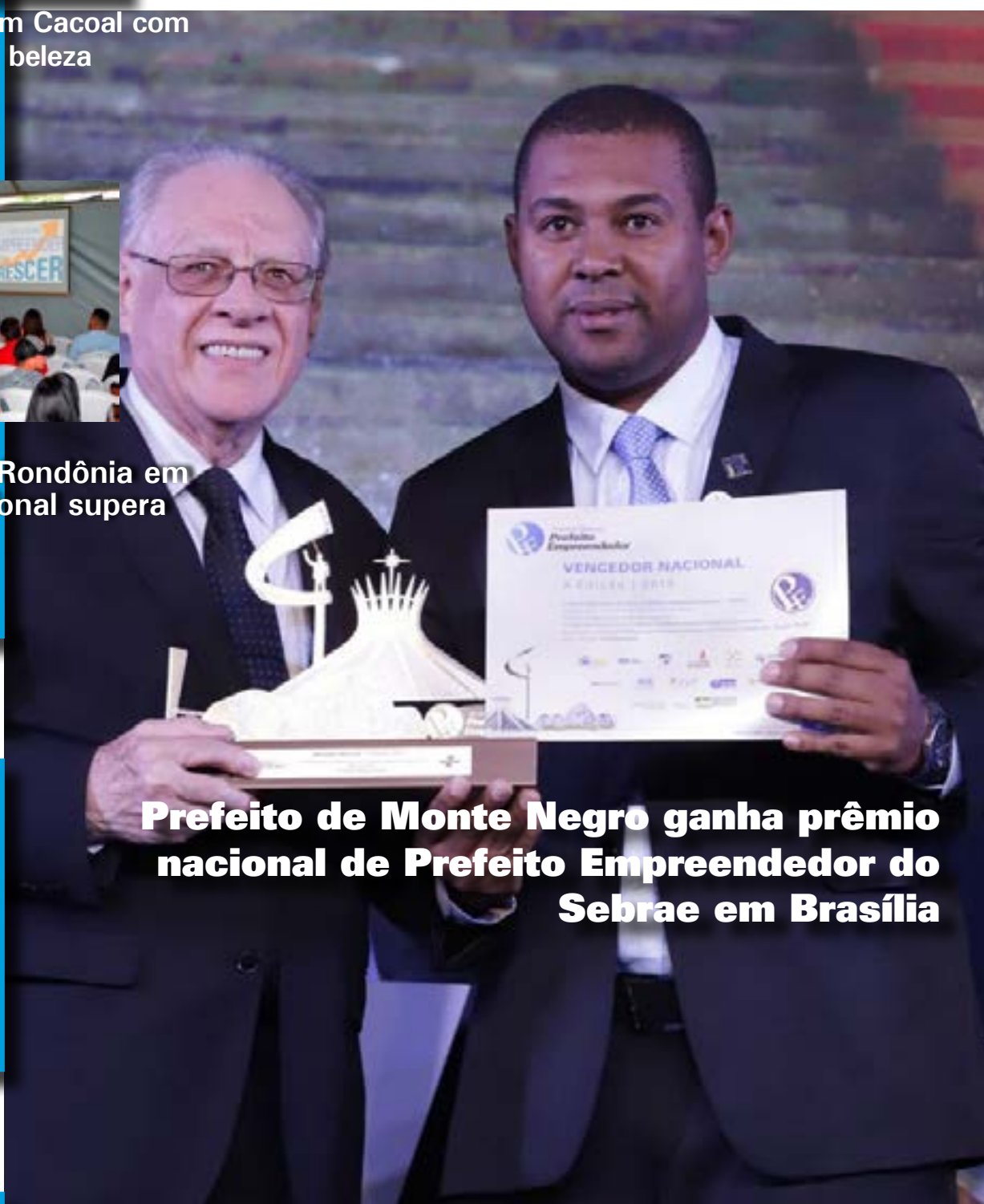
Prefeito de Monte Negro ganha prêmio nacional de Prefeito Empreendedor do Sebrae em Brasília